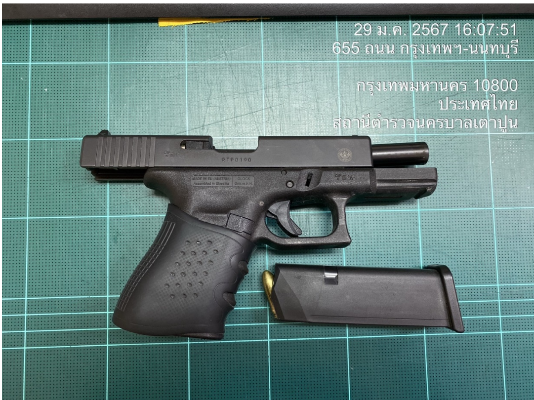
จ.ส.ต.อรรถพล เพี้ยโคตร ผบ.หมู่(ป.)สน.เตาปูน

29 ม.ค. 2567 16:07:51 655 ถนน กรุงเทพฯ-นนทบุรี กรุงเทพมหานคร 10800 ประเทศไทย สถานีตำรวจนครบาลเตาปูน