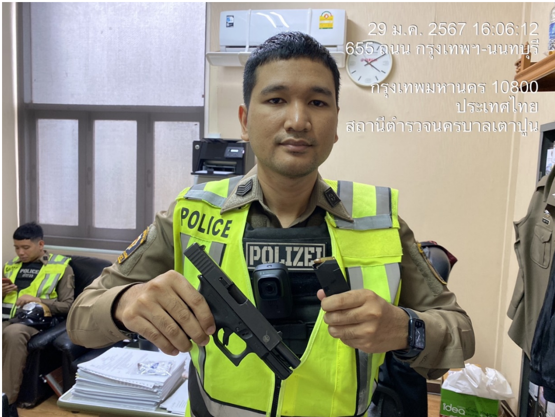
ส.ต.อ.สิทธิชัย จับใจ ผบ.หมู่(ป.)สน.เตาปูน