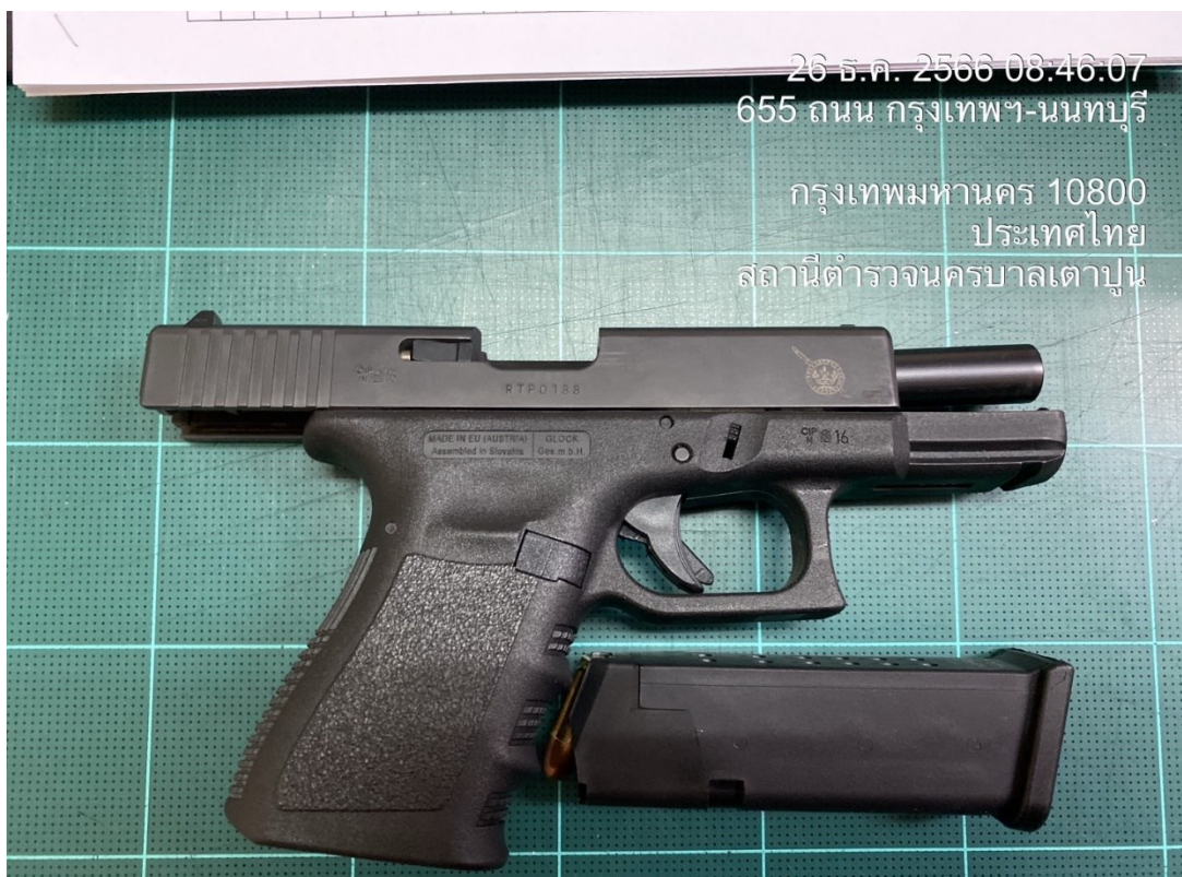
ร.ต.ต.วีระภัทร ยิ้มสิงห์ รอง สว.(ป.)สน.เตาปูน

26 ธ.ค. 2566 08:46:07 655 ถนน กรุงเทพฯ-นนทบุรี กรุงเทพมหานคร 10800 ประเทศไทย สถานีตำรวจนครบาลเตาปูน