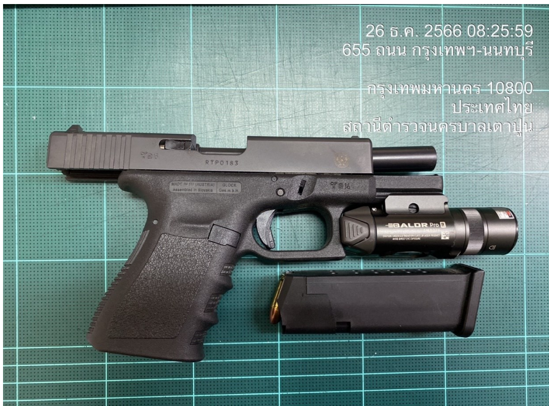
ส.ต.ท.ศราวุธ วงษ์ลา ผบ.หมู่(จร.)สน.เตาปูน

26 ธ.ค. 2566 08:25:59 655 ถนน กรุงเทพฯ-นนทบุรี กรุงเทพมหานคร 10800 ประเทศไทย สถานีตำรวจนครบาลเตาปูน