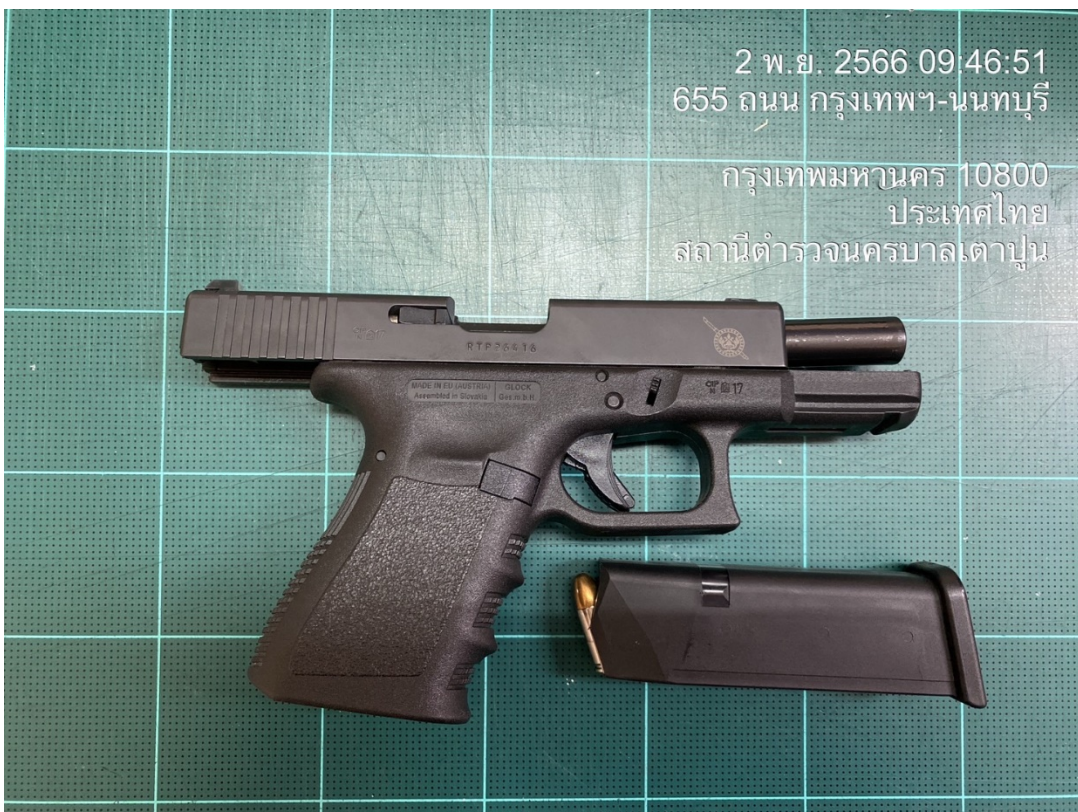
ร.ต.ต.คนวิภัทร ตีร์ตนนธิกุล รอง สว.(จร.)สน.เตาปูน

2 พ.ย. 2566 09:46:51 655 ถนน กรุงเทพฯ-นนทบุรี กรุงเทพมหานคร 10800 ประเทศไทย สถานีตำรวจนครบาลเตาปูน