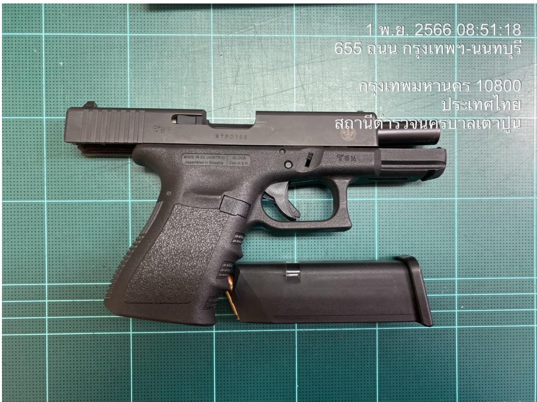
ร.ต.ต.วีระภัทร ยิ้มสิงห์ รอง สว.(ป.)สน.เตาปูน

1 พ.ย. 2566 08:51:18 655 ถนน กรุงเทพมหานคร 10800 ประเทศไทย สถานีตำรวจนครบาลเตาปูน