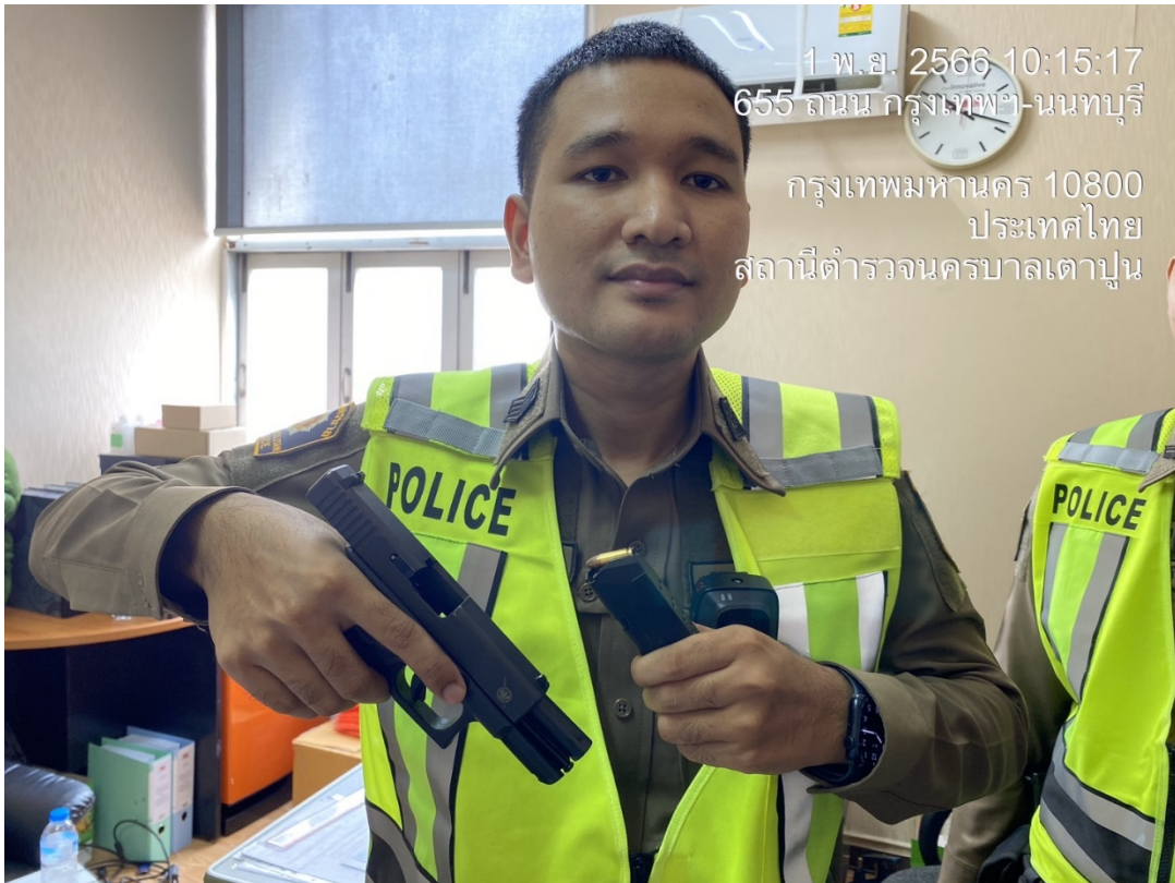
ส.ต.อ.สิทธิชัย จับใจ ผบ.หมู่(ป.)สน.เตาปูน