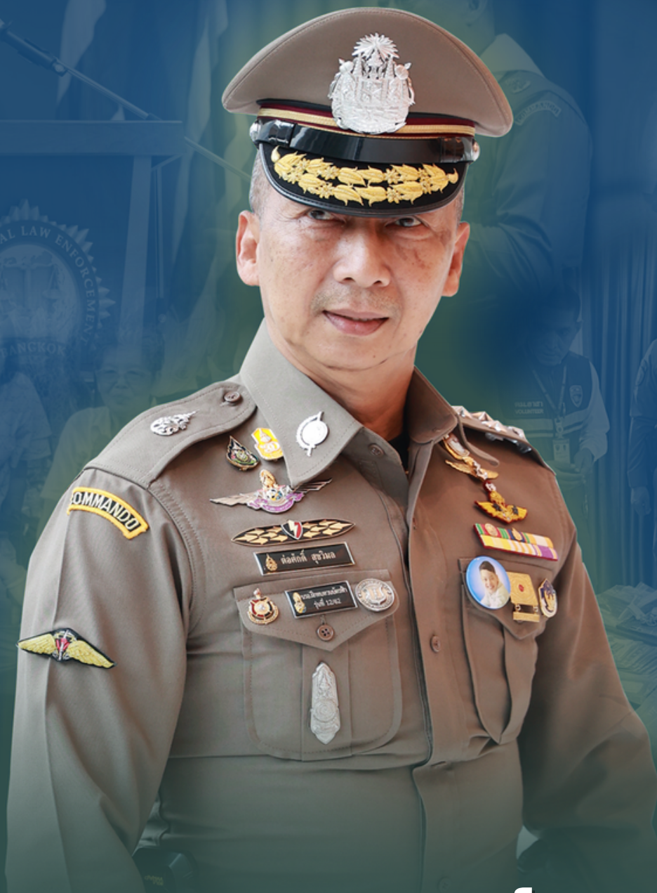
พล.ต.อ.ต่อศักดิ์ สุขวิมล ผู้บัญชาการตำรวจแห่งชาติ คนที่ 14