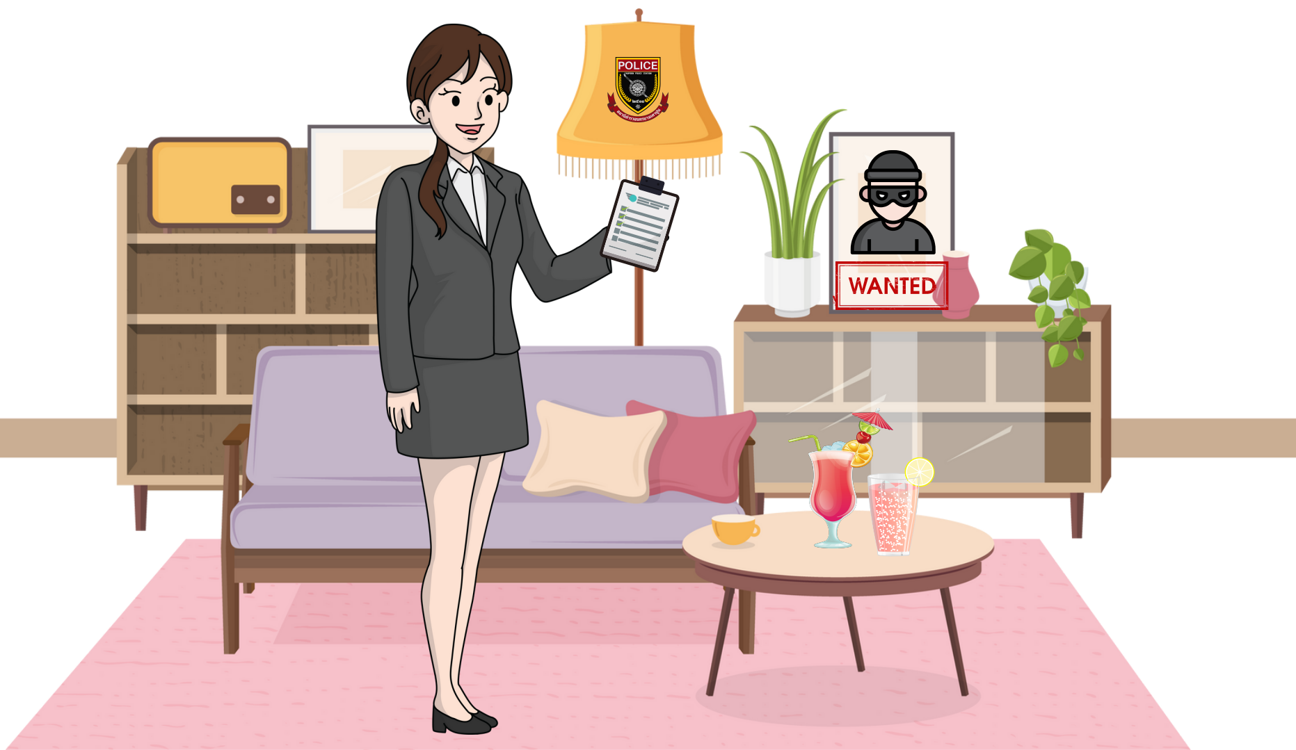
พยานที่ถูกเรียกมาพบ